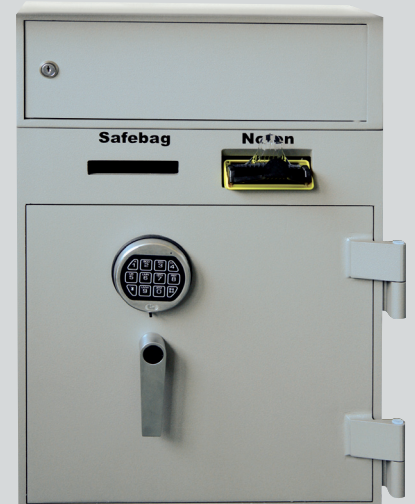
Notendeposit ISH 1200